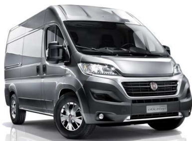
A fotó kizárólag illusztráció!